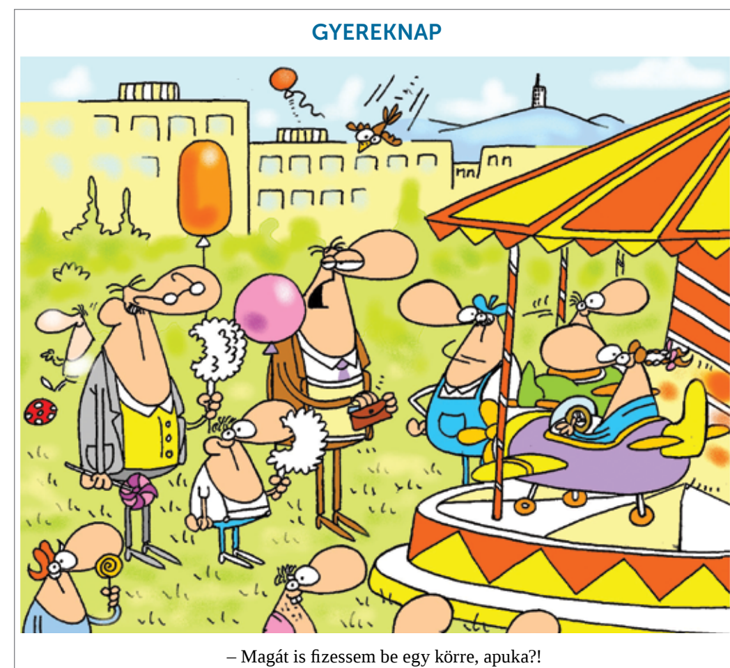
– Magát is fizessem be egy körre, apuka?!